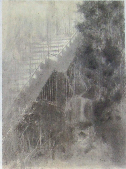
בוש וגרם מדרגות, בבעת שאול, 2021 פחם טבעי על נייר, 2019