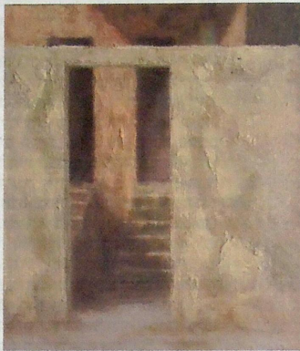
מתוך הסדרה קירות וקולות V, שמן על פשתן, 2017

את מקורם של כוח הרצון, ההתמדה והנכונות להד תמורה עם בעיות שצצות לאורך היצירה, מזהה ברעם בשנות ילדותה בארנגטניה, כאשר אביה, תעשיין וכנר חובב, ייעד אותה ואת אחותיה לקריירה בתחום המוזיקלי. קדו. "עוד לפני שנולדתי, אבי ייעד אותי להיות כנרית. הוא חשב שה איריאלי עמורי ועבור אחותי לפתח קריירה במוזיקה, וכיוון שאנו להעמיק במוזיקה קאי מרית, הכלי שנבחר עמורי היה כינור, לאחותי הבכורה פסנתר, ולאצמעי – צ'לו. כך יצרנו את הטריו, ובנינו