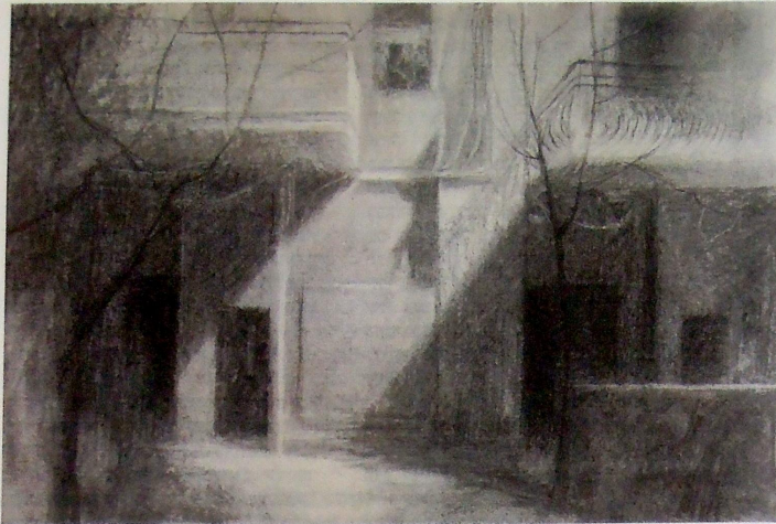
מתוך הסדרה פלורנטין IV, פחם טבעי על נייר, 2019

צויריך (שגם בצניעותם שבפרומט ובנושא יש משום תפילת יחוד), אני מעדיף לשתוק מול צויריך". חלק מן הרישומים בתערוכה מתארים פנים של בית במבט מרוחק מן החוץ, כך שאצל הצופה נוצרת תחרות בין הרישומים של דמויות אדם, ערות מצמררת לתחושות הפרישות והריחוק שכפתה עלינו הקורונה.